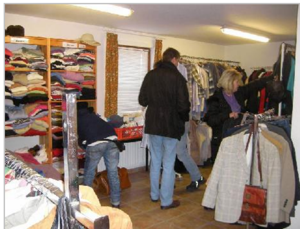
Aktivitäten am Dienstag in den Räumen der Kleiderboutique Das Team der Kleiderboutique Klein Rönna